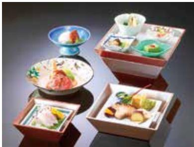
四季彩昼膳 箱膳、主菜、食事、 甘味、珈琲