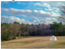
西湖野鳥の森公園