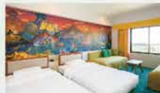
「ディスカバー」スタンダードルーム（一例）