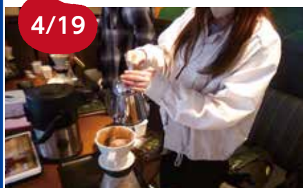
4/19 タリーズコーヒー コーヒースクール基礎編 11名