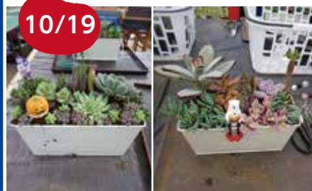
10/19 ハロウィン多肉寄せ植え 15名