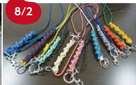
8/2 パラコードで作るシンプルショルダー 9名