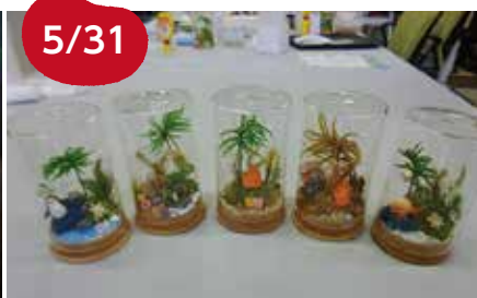
5/31 さとリウム講座 6名