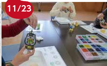
11/23 ミニランタン作り 36名