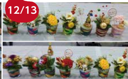
12/13 正月サンドアート 10名