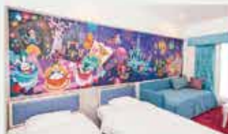
「ウィッシュ」スタンダードルーム（一例）

パークの夢や冒険をそのままに手軽にリゾートステイを楽しめるホテル。 新浦安エリアに位置し、シンプルなサービススタイルで手軽にリゾートステイをお楽しみいただけます。 冒険や発見がテーマの「東京ディズニーセレブレーションホテル：ディスカバー」と、 夢やファンタジーがテーマの「東京ディズニーセレブレーションホテル：ウィッシュ」の2棟からなります。