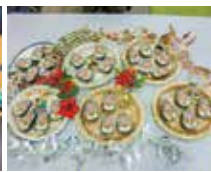
飾り巻き寿司作り