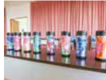
アルコールインクアート体験 (タンブラー製作)