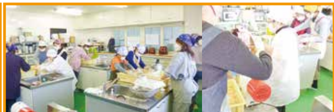
2/4(土) みそ作り 20名