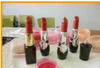
10/8(土) 天然素材でつくるリップクリーム作り 4名