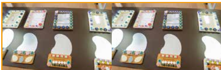
8/6(土) 勾玉ミラースタンドと「フォトフレーム」作り 6名