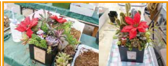
12/3(土) クリスマス多肉寄せ植え 19名