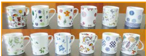
9/17(土) ポーセラーツ体験講座 12名