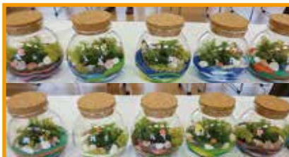
10/1(土) 苔とサンドのテラリウム 10名