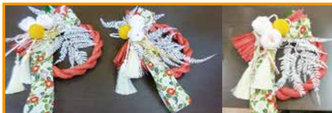
12/17(土) 正月飾りづくり 14名