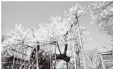
山高神代桜(樹齢2000年)